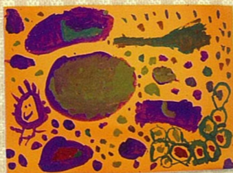
イモの色：紫+緑 / 紫+茶