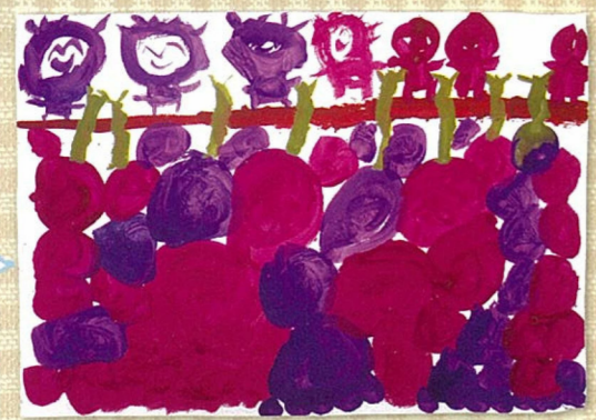
イモの色：紫+赤 / 紫+青