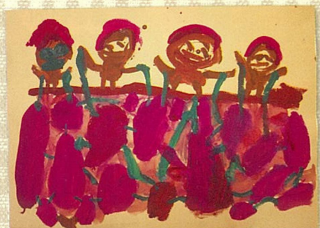
イモの色：紫+赤 / 紫+茶