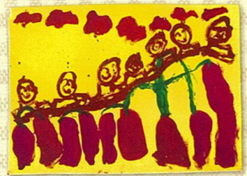
イモの色：紫+赤 / 紫+茶