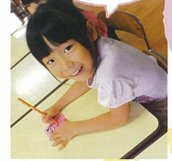
好きな色の画用紙やフェルトペンを使って絵を描きます。