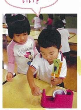
順番など、簡単な約束事も伝えるようにしましょう。

さきにつかってもいい? ゆっくりだときれいはれるね 持つところを考えてストロ―をはるように伝えましょう。