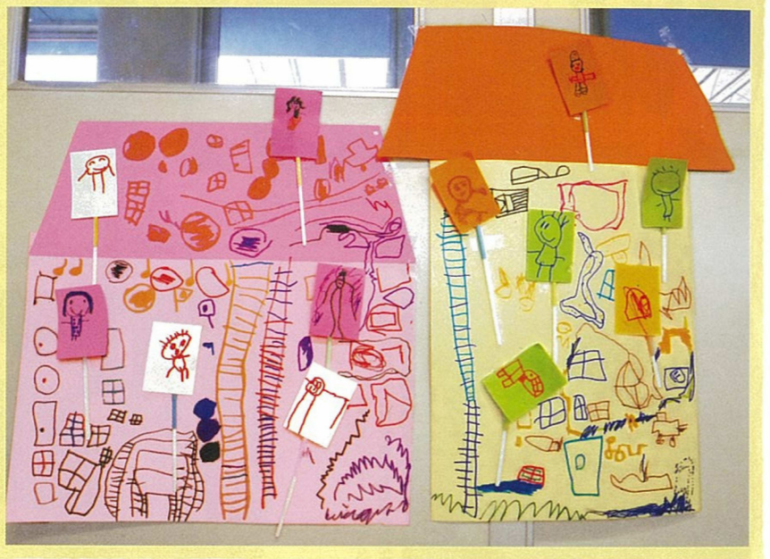
ドアから入る、階段を上る、など想像を膨らませながら家にも絵を描いていきました。遊びが広がりますね。

さきにつかってもいい? ゆっくりだときれいはれるね 持つところを考えてストロ―をはるように伝えましょう。